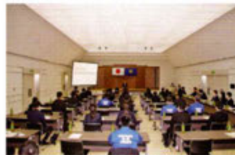
鑑識実務研究発表会