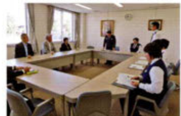
警察学校教職員との懇談