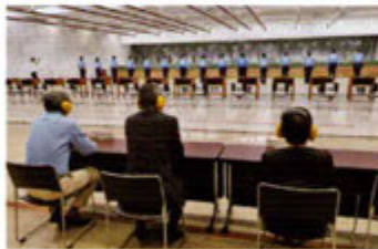
拳銃射撃競技大会

各警察署から選抜された警察官による拳銃射撃競技大会や、鑑識実務研究発表会、実践的総合訓練指導技法発表会等に出席し、警察活動への理解を深めるとともに、出場者を激励しました。