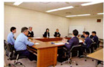
G7派遣部隊員からの活動報告