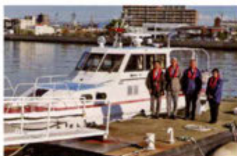
警察船「なると」への乗船

警察船による警戒業務、交通管制センターにおける交通管制業務を視察したほか、交番・駐在所を訪問し、勤務員を督励しました。