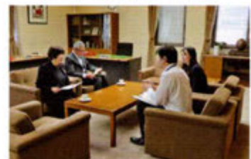
健康指導担当者との懇談