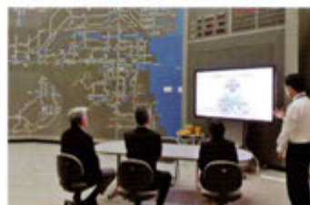
交通管制センター視察