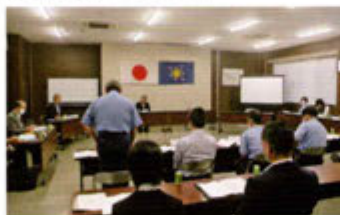
美馬警察署協議会