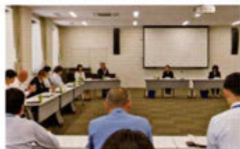
徳島中央警察署協議会

警察署において、開催されている警察署協議会に出席し、各警察署協議会委員と意見を交換しました。