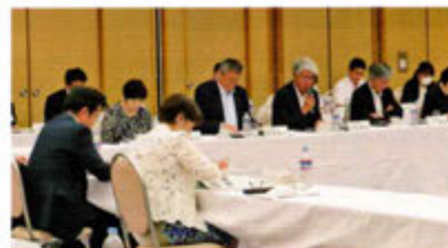
中国四国管内公安委員会連絡会議：広島市